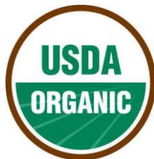
Figura 3. Sello USDA Organic