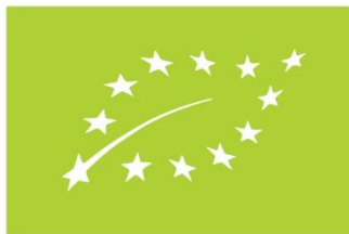
Figura 5. Sello UE