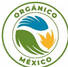
Figura 2. Distintivo Nacional