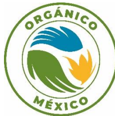
Figura 2. Distintivo Nacional